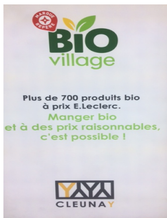
Comparaison des prix Bio village marque Leclerc et des prix moyens en « CoopBio », en €/kg Relevés = 17-24 octobre 2020

Deux raisons majeures des prix élevés relevés en hyper/supermarchés sont cependant tout autres : (i) les produits sont la plupart du temps vendus emballés dans les hyper/supermarchés et (ii) les barquettes, lots ou sachets ainsi vendus sont d'un poids compris entre 500g et 900g selon le produit et sa provenance. À première vue, le prix d'un produit bio emballé semble donc comparable à celui d'un produit Conventionnel et l'erreur faite par le consommateur est de ne pas peser le produit emballé (parfois il n'y a pas de balance au rayon fruits/légumes !). L'emballage représente des coûts de matériaux et de main d'œuvre. Reste à savoir quel est le pourcentage du montant de ces coûts répercuté sur le prix de vente au consommateur. Une solution pour les hyper/supermarchés serait la vente en vrac dans un espace « Bio » dédié avec paiement au niveau de cet espace, comme cela se fait pour les produits de la parapharmacie. Enfin, une publicité présente dans les magasins Leclerc de la région rennaise pour la marque Bio village semble contestable (Figure 3). En effet, quatre des produits enquêtés, vendus sous cette marque, ont des prix déraisonnables comparativement à ceux des « CoopBio ».